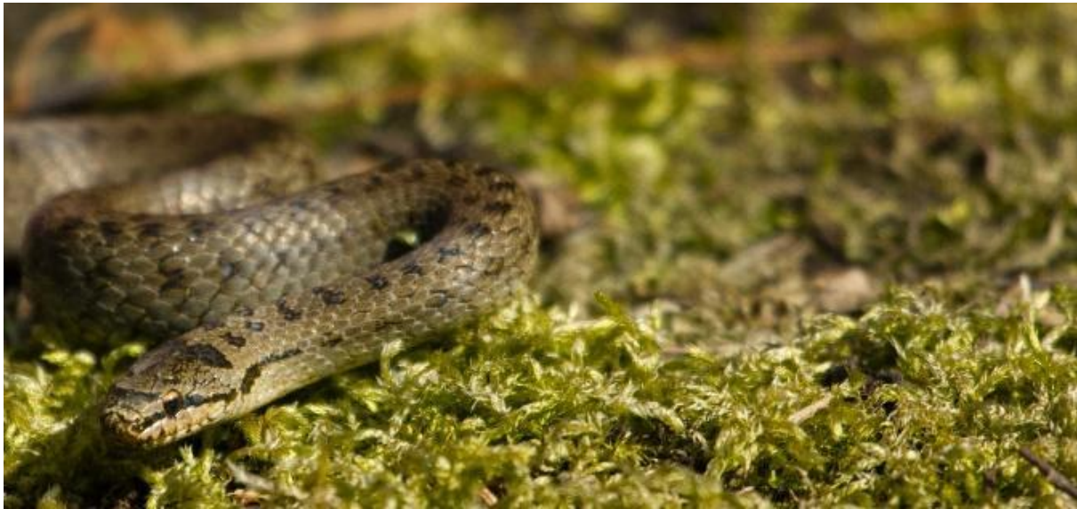
Coronelle lisse.

RDV : La Fiacrie, Momignies. Ligne TEC 156a, arrêt : La Grande Thiérarchie. Infos et inscription : patrice.wuine@cnabh.be . Plus d'infos : www.facebook.com/parcnationalesem et www.cnabh.be