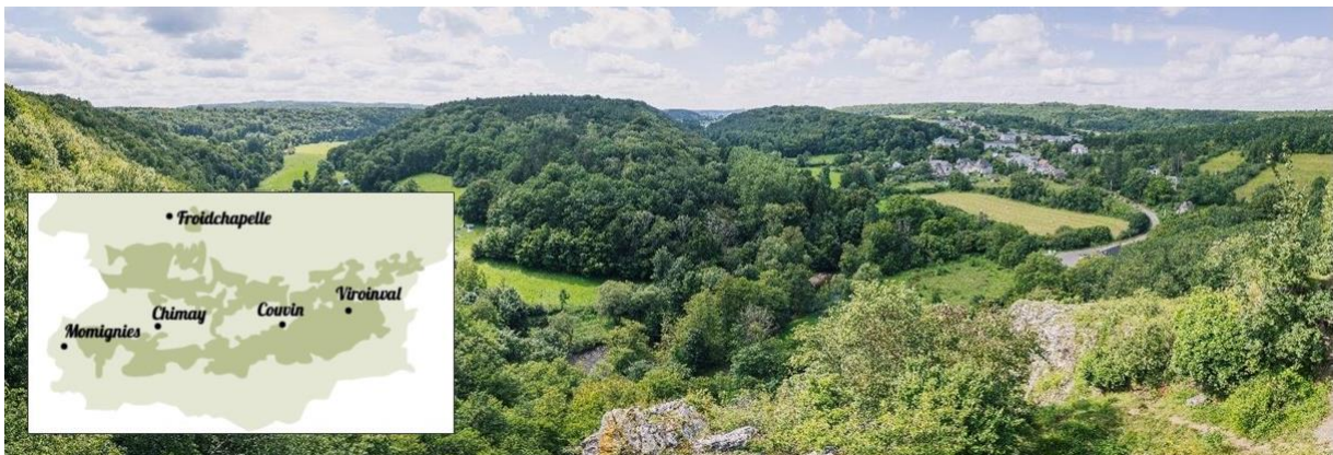
Vallée du Viroin, Dourbes.

AU PARC NATIONAL DE L'ENTRE-SAMBRE-ET-MEUSE