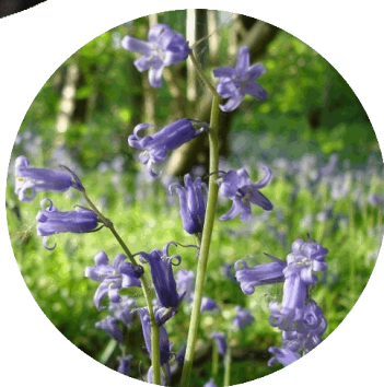
Jacinthe des bois