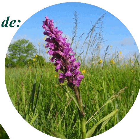
Orchis de mai