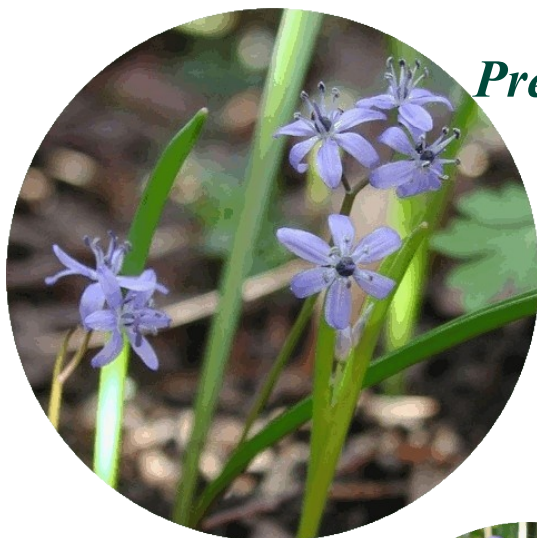
Scille à deux feuilles

Présence avérée sur le site, notamment de: