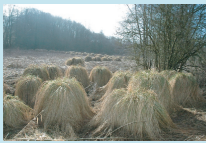
Vue générale sur les touradons en hiver