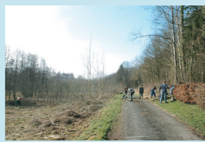
Journée de Gestion - Mars 2005