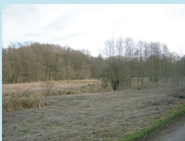
Vue générale sur la réserve en hiver