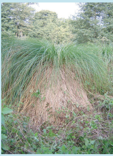
Gros plan sur un touradon de Laïche paniculée - Hauteur = 1,5m