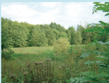
Vue générale sur la réserve en été